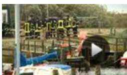
Familientragödie auf hoher See: Fischkutter gesunken