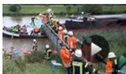
Binnenschiff rammt Brücke – Bergungsarbeiten...